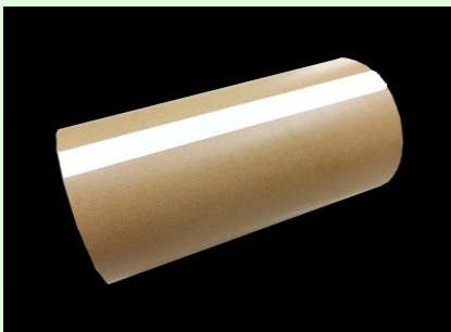
①紙管に貼り付ける。