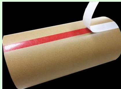
②上の剥離紙をはがす。