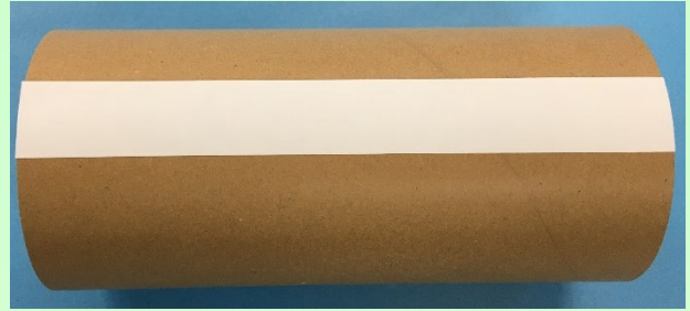
高グリップ紙管 (HC/NC-H タイプ)