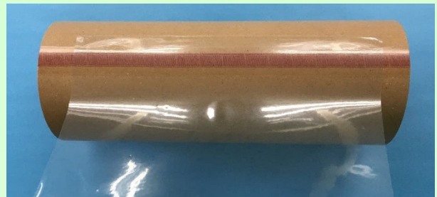
②フィルムをセット