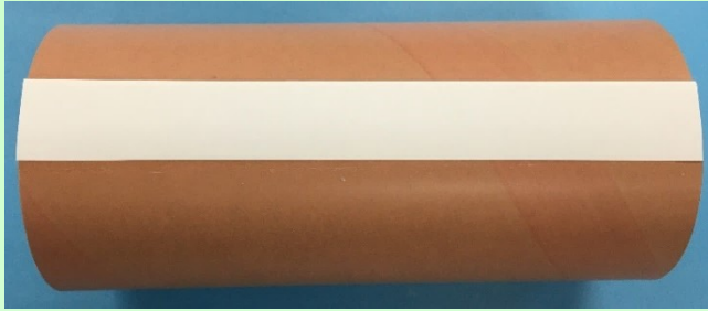
高グリップ紙管 (NC-N/NP タイプ)